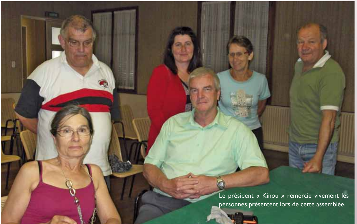
Le président « Kinou » remercie vivement les personnes présentes lors de cette assemblée.